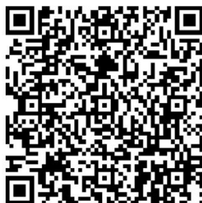
2021粤港澳大湾区工艺美术博览会