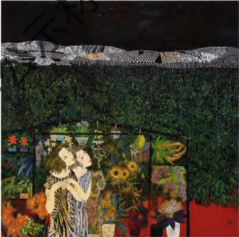
《流星雨》局部附第15页

作品照片：要求3张不同方位图片，尺寸为6寸（152×102mm），分辨率为300dpi