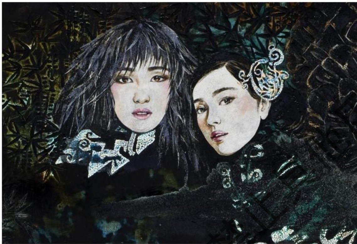
漆艺作品《动漫cosplay》局部1、2